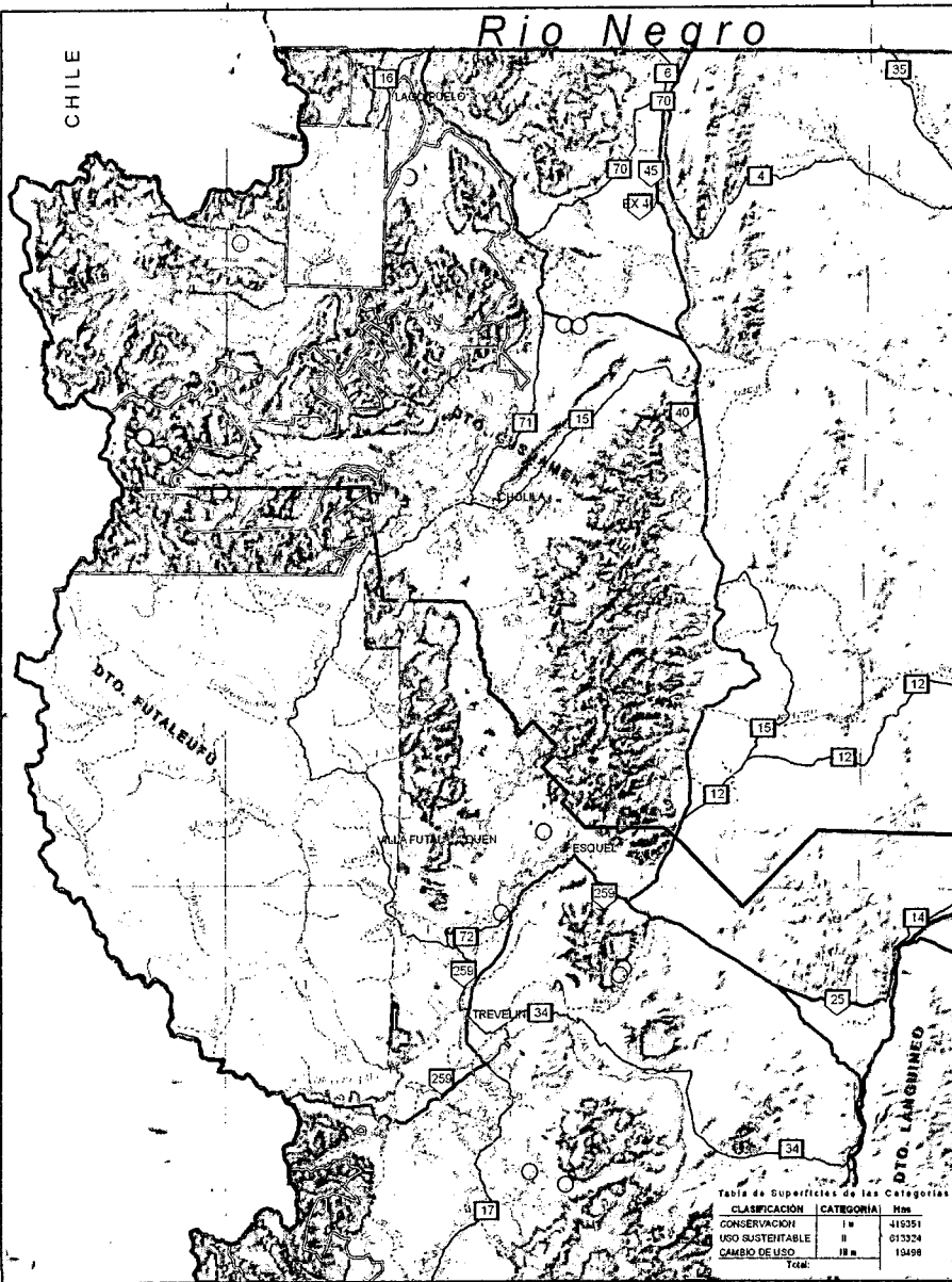
Tabla de Superficies de las Categorías